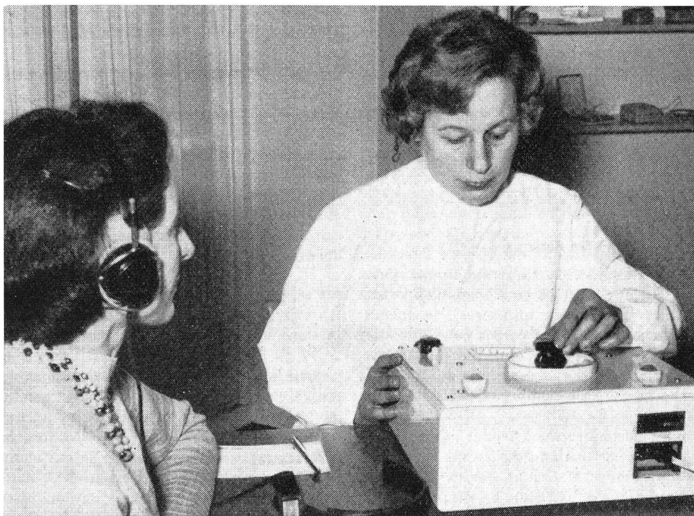
L'assistente stabilisce un audiogramma se il paziente non ne porta uno preparato dal medico

E' stato constatato, in alcuni casi difficili, che un paziente pur con l'apparecchio acustico può distinguere in maniera chiara, in principio, soltanto il 20 per cento delle parole. Dopo quattro settimane di esercizio con lezioni speciali, già le distingue in misura del 40 per cento, dopo due o tre mesi si arriva al 70 per cento.