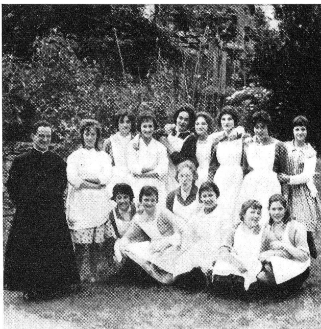
Cevio. Dopo la cerimonia di chiusura del corso di economia domestica

La fondazione di queste scuole di economia domestica, della durata di nove mesi, per le ragazze tra i 14 ed i 15 anni è costata alle autorità cantonali e comunali non poche preoccupazioni. Dove trovare i locali, come sistamarli? Si è ancora in periodo di esperimento e non tutte le scuole possono essere installate, soprattutto nelle valli, in antiche ville come è avvenuto per Neggio. Ammirazione, dunque, per questo esperimento portato innanzi con coraggio e sacrificio da parte di maestre di economia domestica alle quali si chiede, praticamente, di formare le ragazze in maniera com-