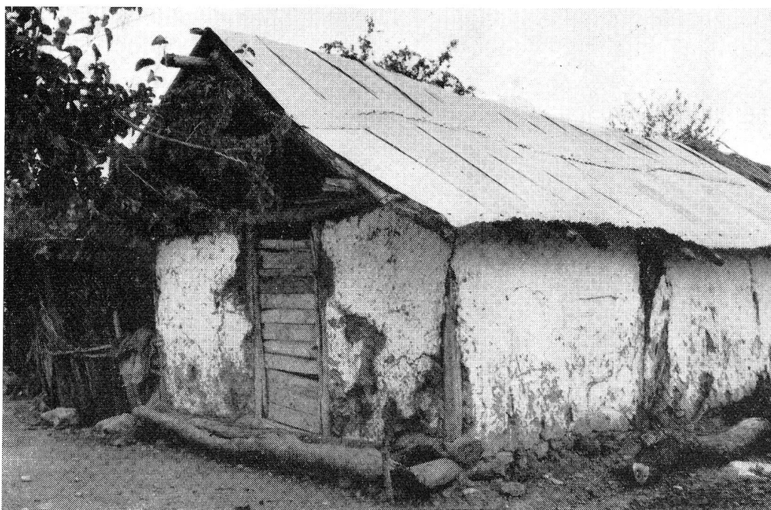
Quelque part en Grèce, une vieille masure

temps préhistoriques, la région fut l'un des centres les plus importants d'où se sont répandues sur tout le pays les vagues de l'immigration dorienne. L'Épire connut des années de prospérité. Dodone, toute proche de Joannina, la capitale, est célèbre pour son oracle de Zeus qui fut l'un des plus célèbres de la Grèce antique, respecté et craint de tous. La grande époque de l'Épire coïncide avec le règne du terrible roi Pyrrhus, au III e siècle av. J.-C. Après l'effondrement de l'empire de Byzance, un petit état indépendant fut fondé en