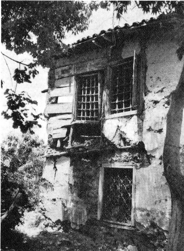
Vieille maison turque. Ses hôtes ont pu trouver un foyer plus sain: la maison neuve que vous avez vue à la page précédente

crissante. Il reçoit pour sa peine une drachme toute neuve qu'il serre dans ses deux menottes sales. Lorsque nous nous apprêterons à quitter le village de ruines, nous aurons des cigales plein les poches!