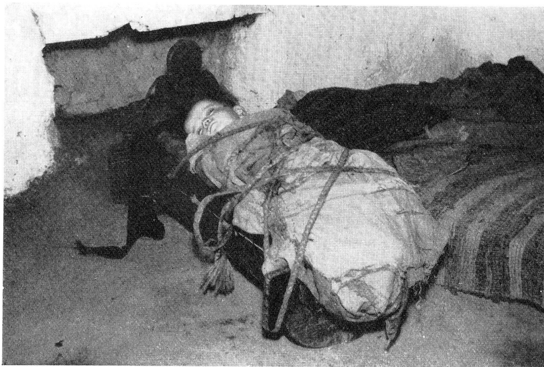
Bébé dormant dans son berceau attaché par une grosse corde Il semble que ce soit une vieille coutume chez les villageois de Grèce

Poursuivons donc notre route sur les chemins caillouteux et dans la poussière blonde: il y a encore de nombreux villages de ruines et de boue où des maisons dignes de ce nom doivent à tout prix remplacer les masures.