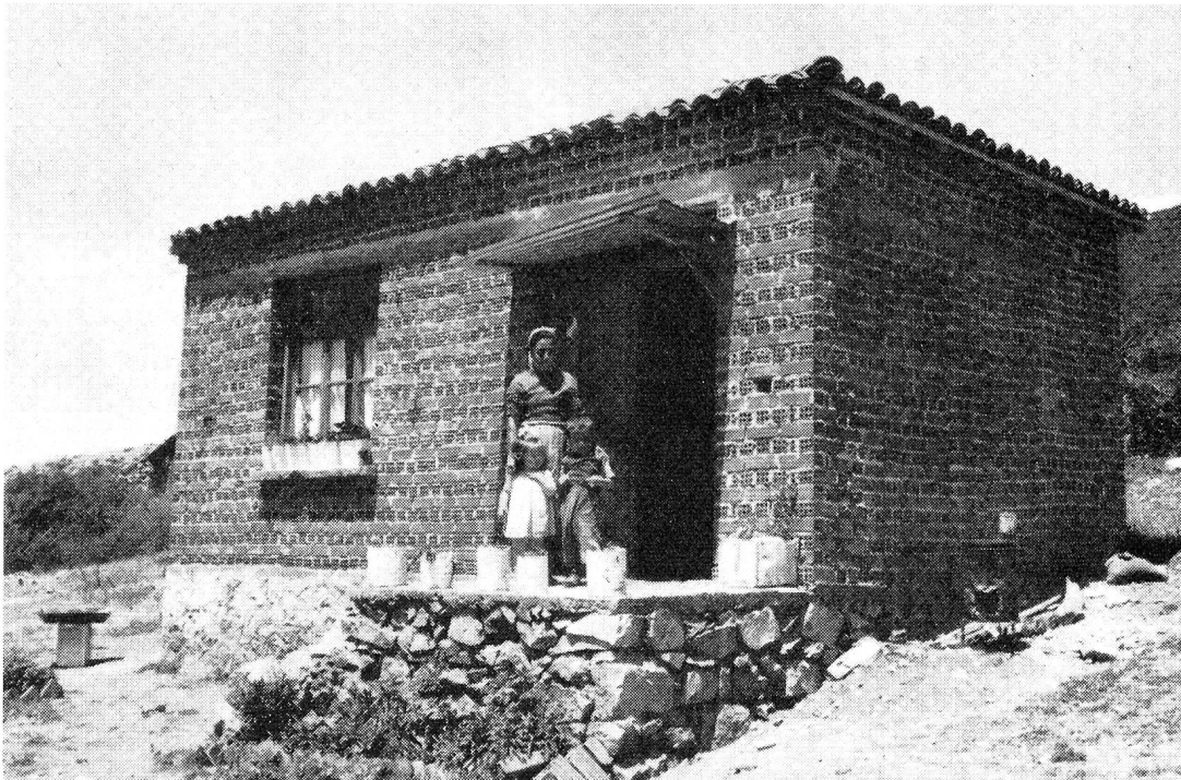
Quelque part en Grèce, une maison neuve s'élève aujourd'hui...

Pour l'heure, le transport des bagages représente quasiment la seule possibilité de travail offerte aux hommes. Les bras ne manquent pas à l'arrivée des ferry-boats qui, venant de Patras ou de Corfou, touchent terre à Igoumenitsa. Le premier ferry-boat, le deuxième, le dernier — celui du soir —: le pain quotidien.