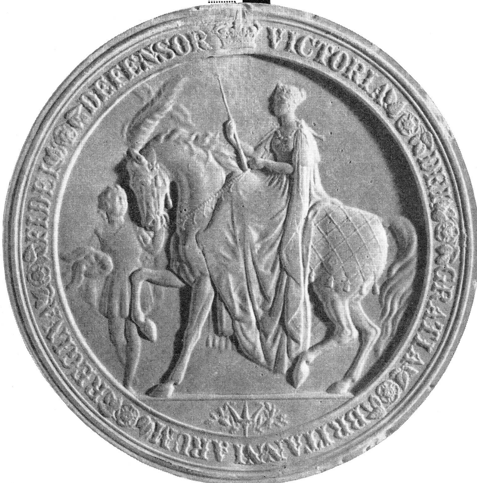
Sceau apposé sur un brevet anglais datant de 1868

Fidèle à une longue tradition, CIBA bâtit sa renommée sur les succès de la recherche scientifique dans les divers secteurs de son activité.