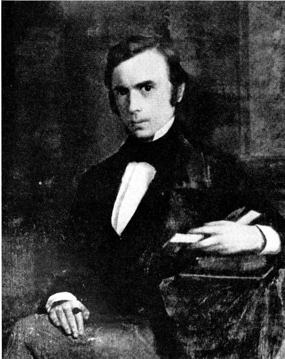
Le docteur Louis-P.-A. Appia (1818-1898) porta le premier le brassard blanc à croix rouge sur un champ de bataille au Sleswig en 1864

Grâce, en grande partie, à l'intervention de Napoléon est réunie, à Genève, la Conférence de 1863. Cette Confé-