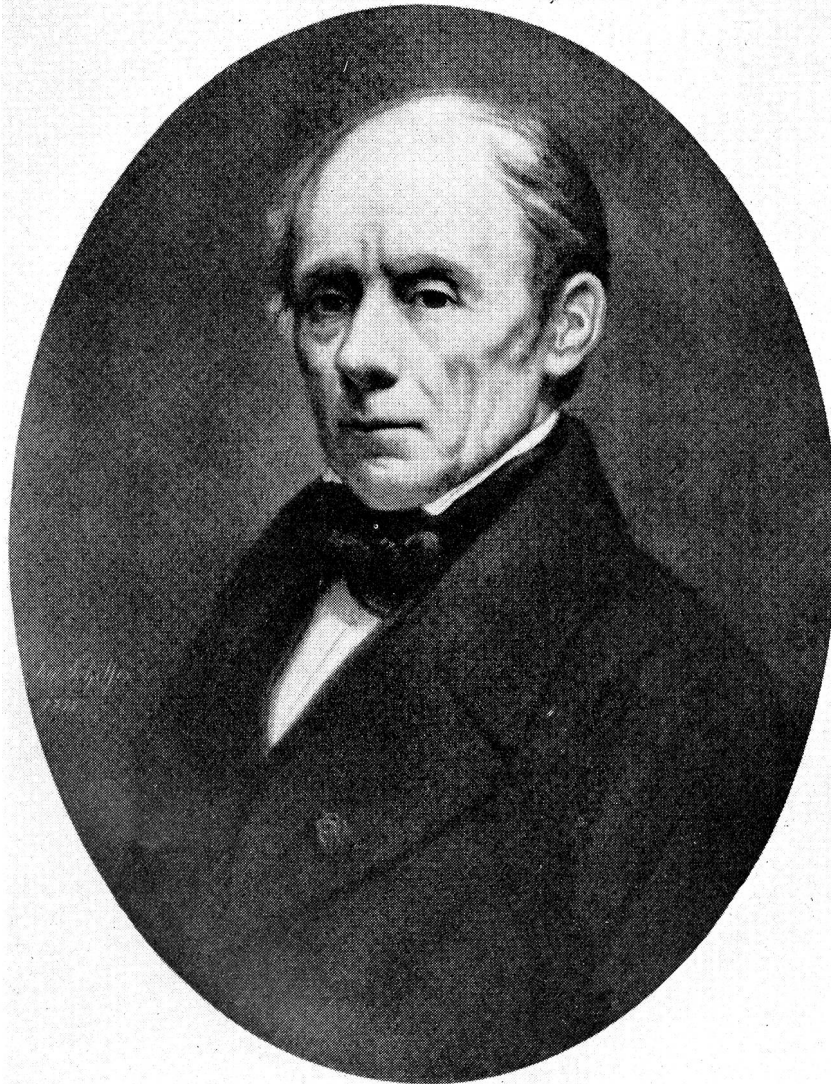
Le général G.-H. Dufour (1787-1875), commandant de l'armée suisse pendant la guerre du Sonderbund, président des délibérations qui amenèrent la conclusion de la Convention de Genève de 1864, président honoraire du Comité international