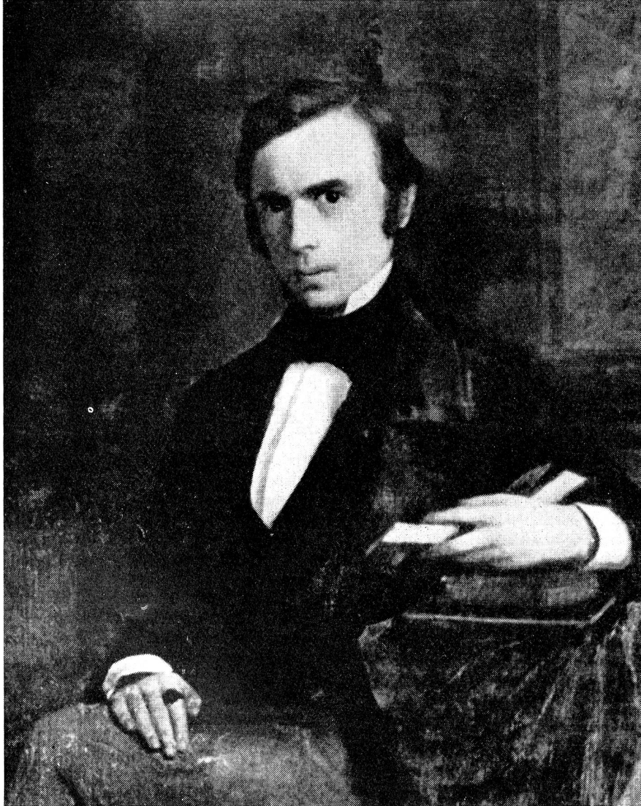
Le docteur Louis-P.-A. Appia (1818-1898) porta le premier le brassard blanc à croix rouge sur un champ de bataille au Sleswig en 1864

Grâce, en grande partie, à l'intervention de Napoléon est réunie, à Genève, la Conférence de 1863. Cette Confé-