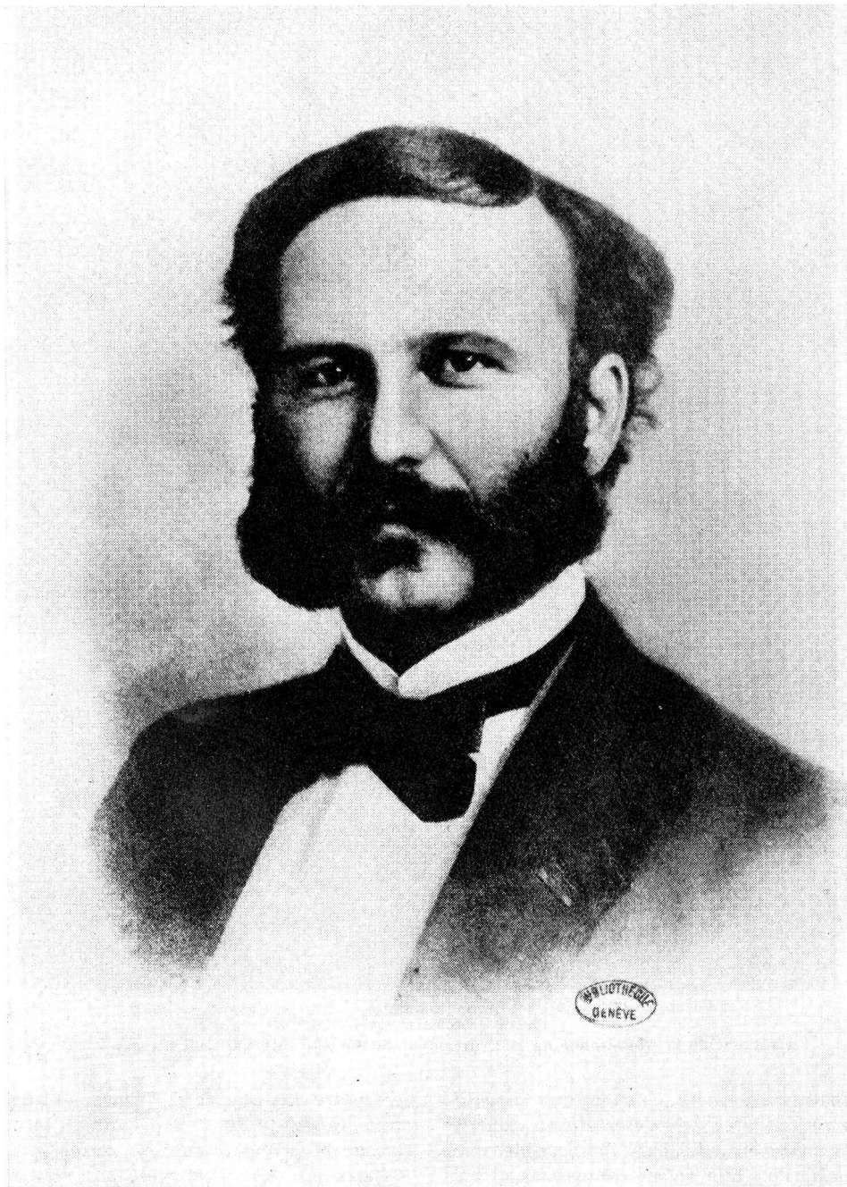
J.-H. Dunant (1828-1910), le semeur d'idées

par toute l'Angleterre. Une admirable femme, Florence Nightingale , bouleversée par ces tableaux d'horreur, réunit un groupe d'infirmières et réussit à se faire envoyer, elle et ses compagnes, par le Gouvernement,