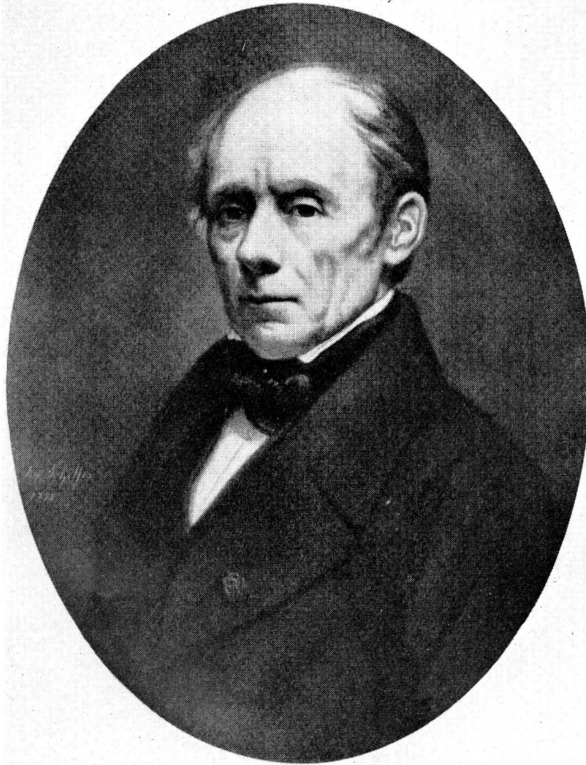
Le général G.-H. Dufour (1787-1875), commandant de l'armée suisse pendant la guerre du Sonderbund, président des délibérations qui amenèrent la conclusion de la Convention de Genève de 1864, président honoraire du Comité international

comme Florence Nightingale, comme Louis Appia, il est effaré de ce qu'il voit, des horreurs du champ de bataille, du manque de moyens d'hospitalisation, des blessés laissés, par force, sans soin durant des heures. Bon samaritain, il se multiplie, il fait tout ce qu'il peut dans la limite de ses moyens, il tente d'apporter quelque douceur aux malheureux souffrants; la fumée du tabac,