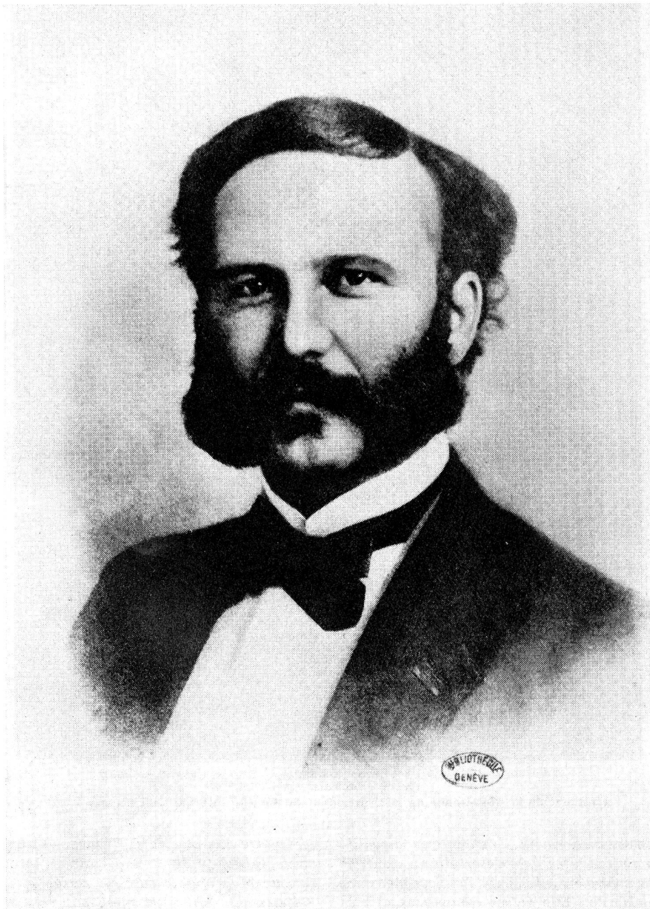
J.-H. Dunant (1828-1910), le semeur d'idées

par toute l'Angleterre. Une admirable femme, Florence Nightingale , bouleversée par ces tableaux d'horreur, réunit un groupe d'infirmières et réussit à se faire envoyer, elle et ses compagnes, par le Gouvernement,