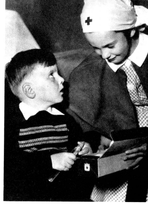
En Australie: Distribution de boîtes-cadeaux de la Croix-Rouge américaine dans un hôpital

DANS LE MONDE ENTIER, JUNIORS D'AUJOURD'HUI PREPARENT LA CROIX-ROUGE DE DEMAIN. ILS SONT MILLIONS (CONTRE 107 MILLIONS DE MEMBRES ADULTES) QUI METTENT JOURNELLEMENT EN PRATIQUE LES TROIS PRINCIPES DE LA CROIX-ROUGE DE LA JEUNESSE: ENTRAIDE - HYGIENE ET SANTE - COMPREHENSION INTERNATIONALE