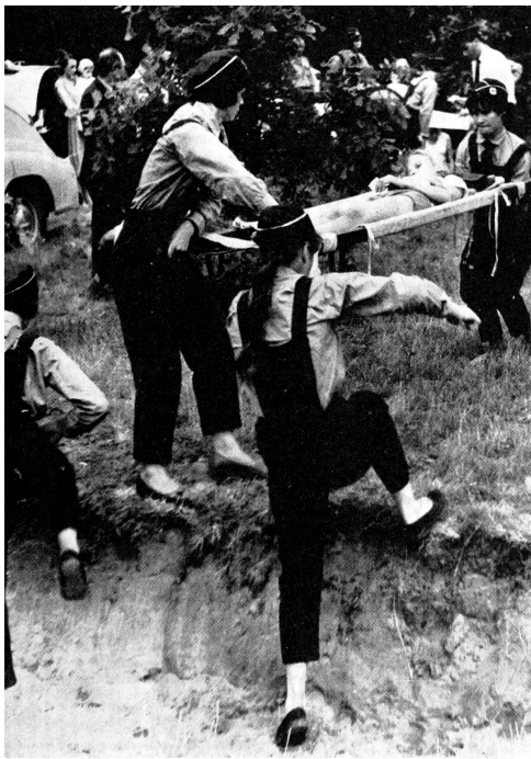
Des juniors polonais exercent les premiers secours