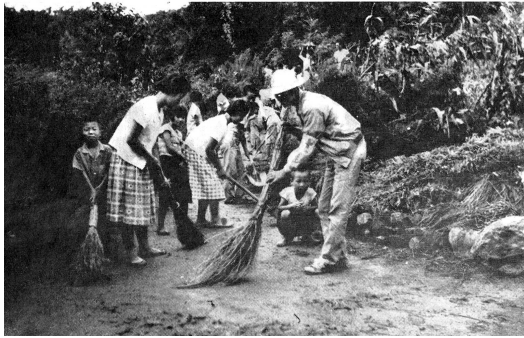
En République de Corée, des juniors balaient les rues de leur village