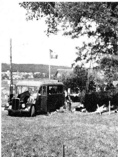
Le 25 août 1963 à Colombier