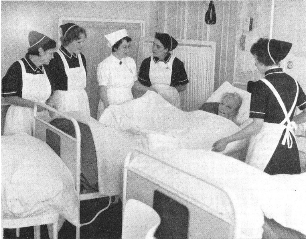
Sept écoles — dont une à Lausanne — forment des aides-soignantes qui rendent de précieux services auprès des malades chroniques ou des vieillards. La formation est de 18 mois et comprend 240 heures d'enseignement théorique.

Notre époque, caractérisée par la pleine occupation, le bien-être général, le nombre croissant des automobiles et l'exiguïté des appartements est une période favorable pour les bien-portants mais souvent plus difficile pour les personnes âgées et impotentes. L'on n'a ni temps ni place pour eux. Certes, des mesures de pré-