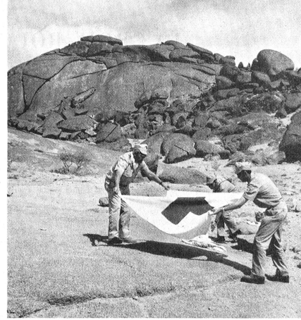
Sur l'emplacement de l'hôpital de campagne qui sera entièrement installé sous tentes, la pose de la « première pierre », en l'occurrence le drapeau à croix-rouge sur fond blanc, l'emblème de solidarité, de neutralité, d'humanité sous lequel la mission suisse exercera son activité.