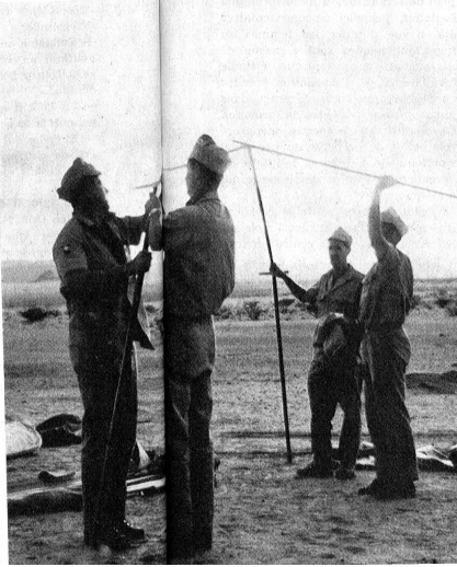
Dans le désert, l'hôpital « suisse » n'est plus un mirage...