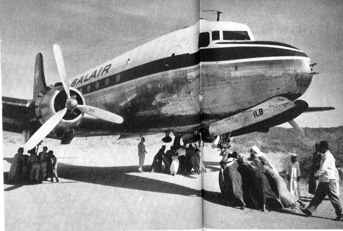
A l'exception d'un « Clinobox », bloc chirurgical portatif, acheté en Allemagne, le matériel nécessaire à l'installation et à l'exploitation de l'hôpital est expédié de Suisse. Un avion de la compagnie d'aviation suisse vient d'atterrir en plein désert, dans la zone démilitarisée qui, au nord du pays, sépare le Yémen de l'Arabie saoudite. C'est dans cette zone que la mission médicale suisse déploiera son activité.