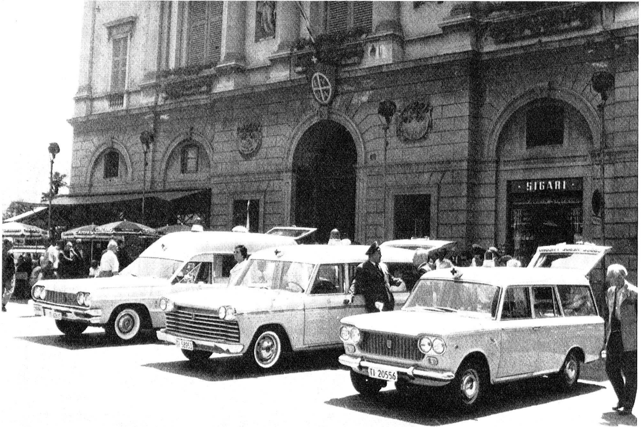
Le nuove autolettighe della Croce Rossa verde di Lugano inaugurate nell'estate 1965.