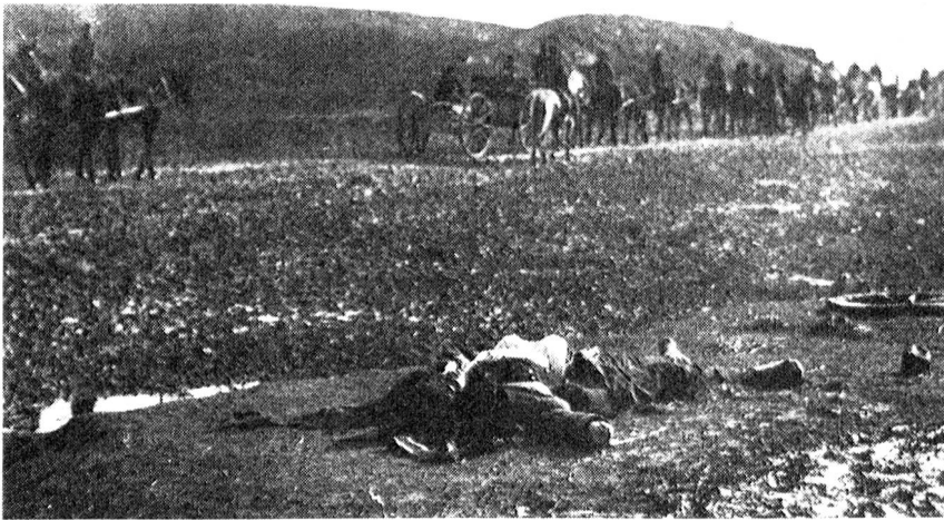
Campo di battaglia in Albania.