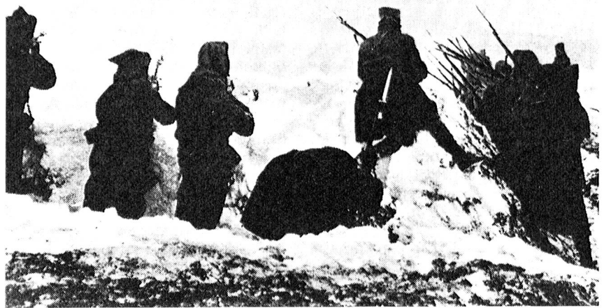
Combattimento in Albania.