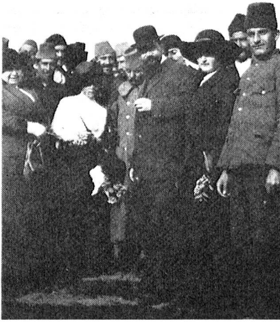
Nella fortezza di Belgrado, prigionieri turchi insieme a medici e infermieri svizzeri della missione della Croce Rossa.