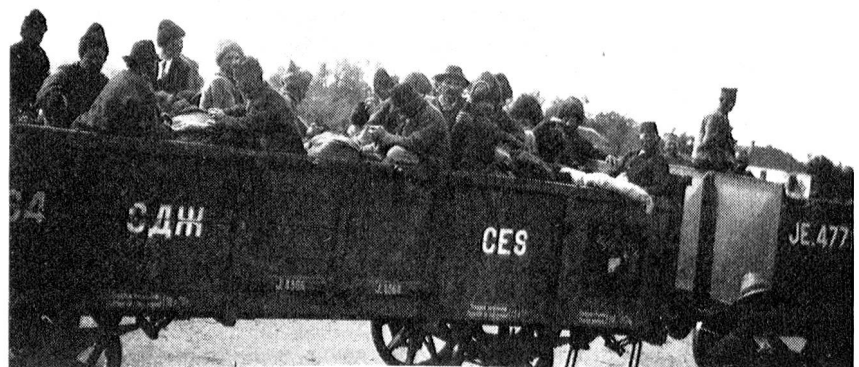
Trasporto di soldati serbi.