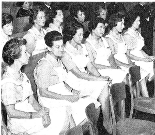
Ci-dessus, la dernière volée genevoise le jour de la remise des certificats. Ci-dessous, des écolières bernoises attentives à la théorie enseignée par l'infirmière.