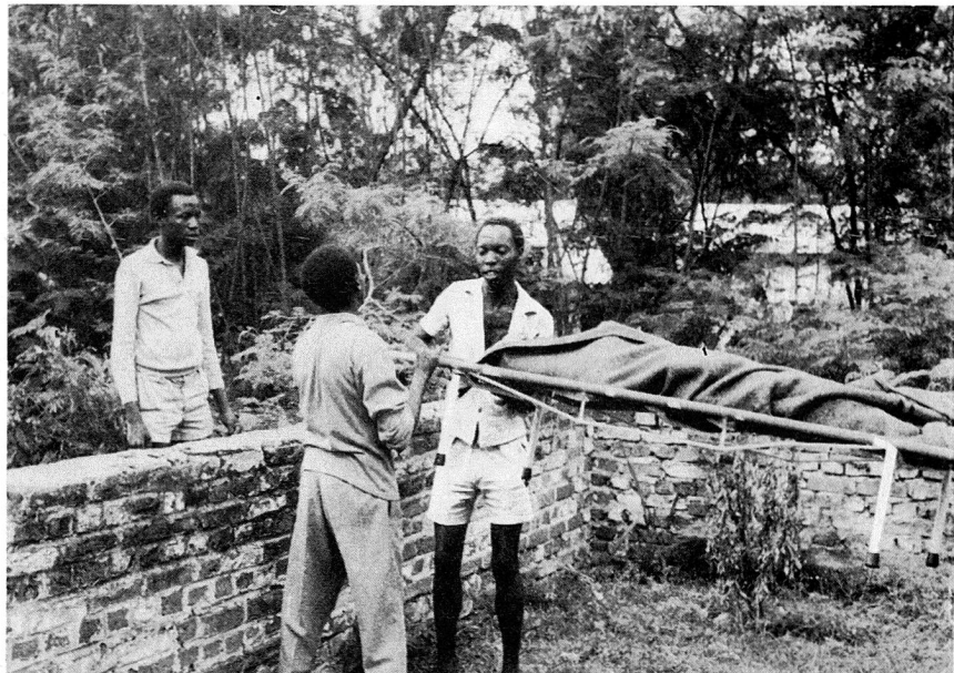
Exercice de transport de blessés par des élèves d'une école normale