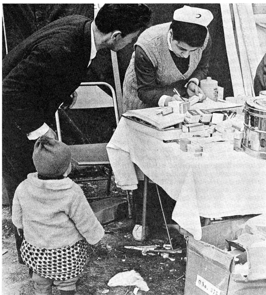
Mars 1970: le tremblement de terre qui sévit en Anatolie occidentale fait 150 000 sans-abri. Des volontaires du Croissant-Rouge turc donnent des soins médicaux aux victimes.

Le projet du Département politique fédéral a, dans le meilleur sens du terme, un caractère suisse, car il est conçu au vu de ce qui existe et de ce qui a fait ses preuves et qu'il vise à