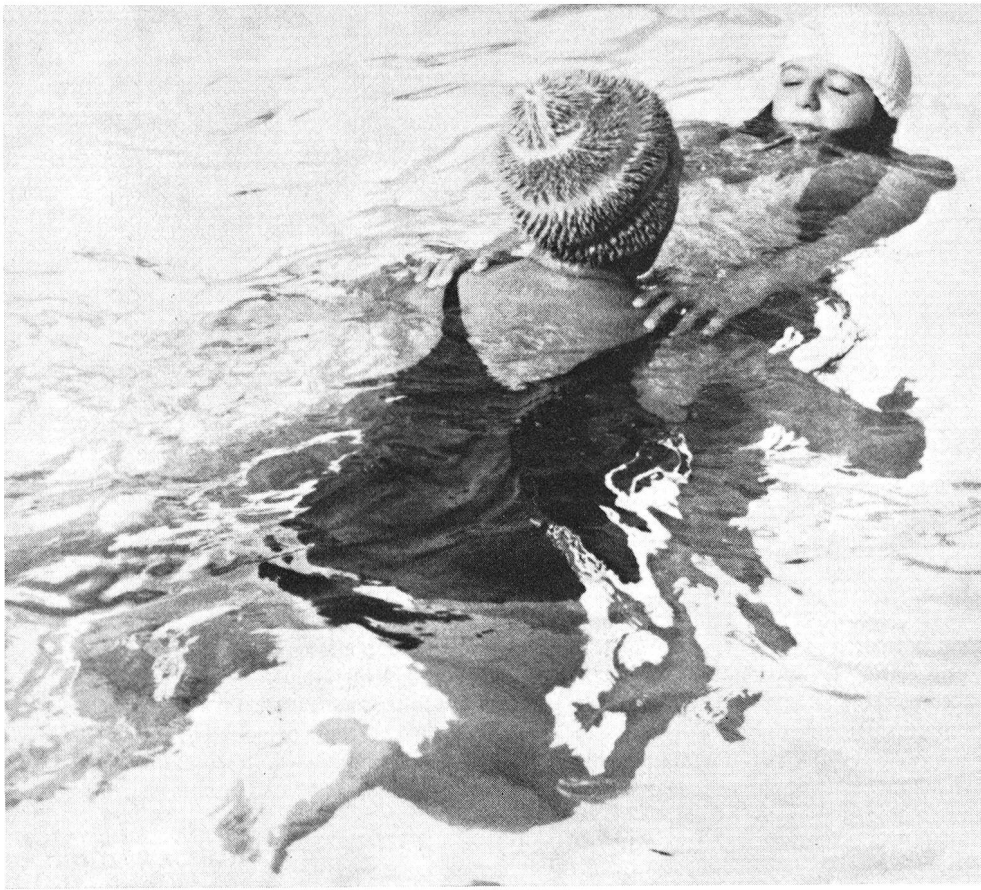
La monitorice impartisce la prima nozione del salvataggio in acqua.