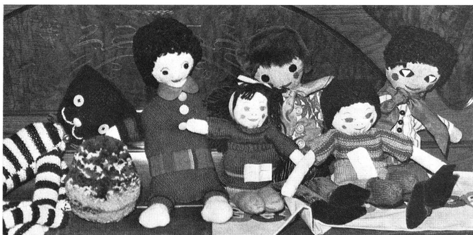
Des poupées pour enfants sages qui, de même que tous les objets confectionnés au cours de l'année, seront vendus dans le cadre de bazars.