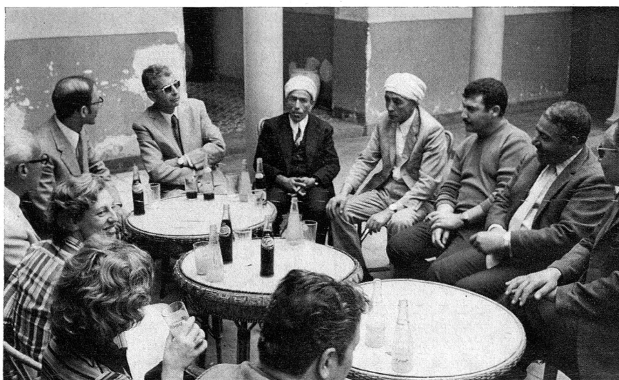
Accueil d'une délégation de la Croix-Rouge suisse par le Comité régional «in corpore» de la petite localité de Djemilla.