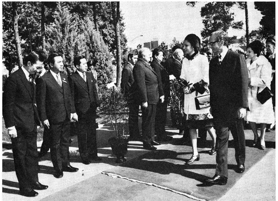
Leurs Majestés impériales le Sha-in-shah Aryamehr et la Shahbanou Farah saluent personnellement les délégations réunies dans les Jardins de l'Opéra, après la cérémonie solennelle d'ouverture de la XXIIe Conférence internationale de la Croix-Rouge.

Le deuxième protocole élargit la protection prévue en faveur des victimes de conflits internes aux termes de l'article 3 commun aux quatre Conventions de Genève. Les dispositions de ce protocole concernent la protection accordée aux personnes détenues par la partie adverse, la protection et les soins donnés aux blessés et aux malades, la protection de la population civile contre les effets des hostilités, les opérations de secours entreprises en faveur de la population civile, ainsi que les mesures protectrices