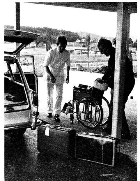
Après avoir quitté leur domicile ou le home où ils sont soignés, les invalides sont confiés aux troupes sanitaires qui voyagent avec eux en wagons réservés jusqu'à Fiesch.

Il ne faudrait surtout pas croire que les handicapés allaient servir de cobayes à la troupe. Toute la mise sur pied du camp a été faite en tenant rigoureusement compte d'un principe directeur: les «invités» devaient se sentir vraiment en vacances et non pas à l'hôpital. Un programme varié de distractions, de jeux et de divertissements avait été minutieusement préparé, sans que rien ne soit négligé pour assurer les soins qu'exigeait l'état de ces invalides atteints d'hémiplégie, de tétraplégie, de sclérose en plaques et autres graves infirmités, se déplaçant pour la plupart uniquement en chaise roulante. Chacune des cinq stations de traitement du camp de vacances comptait un médecin, deux infirmières, deux sous-officiers et 28 soldats sanitaires,