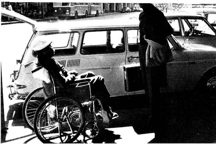
Dans plusieurs villes, les automobilistes bénévoles des sections de la Croix-Rouge se sont mis à disposition pour amener les invalides à la gare le jour de leur départ et aller les y rechercher à la fin du séjour.

Parmi les principes qui ont été formulés par la commission concernant le service sanitaire et qui seront soumis à l'état-major de la défense, les trois plus importants sont les suivants: