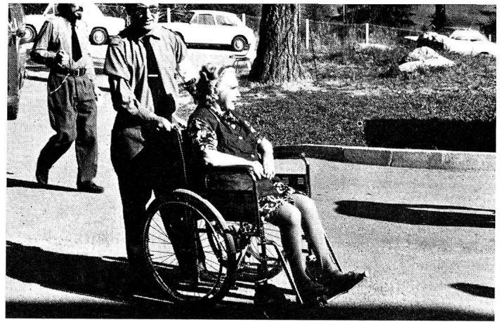
Chaque soldat était tout dévoué à «son» patient.