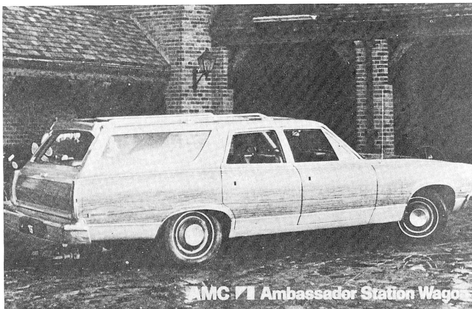
Sopra: la prima autolettiga...

Durante tutto il tempo degli interventi le autolettighe saranno in costante contatto radio con la Sede, e questo per i motivi più ovvi. Un'antenna delle PTT installata sul Monte Tamaro permette di mantenere il sopracitato collegamento non solo nel normale raggio d'azione dell'E. R. A. ma in tutto il Sottoceneri ed in parte nella limitrofa fascia di frontiera.