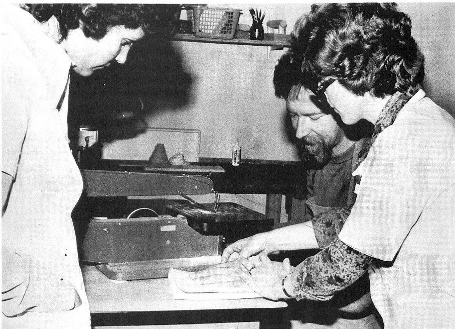
Les assistantes bénévoles préparées à cette tâche particulière et qui travaillent sous la direction de l'ergothérapeute sont intervenues l'an dernier à 6000 reprises auprès de personnes âgées ou de malades chroniques auxquels elles font confectionner des travaux manuels.