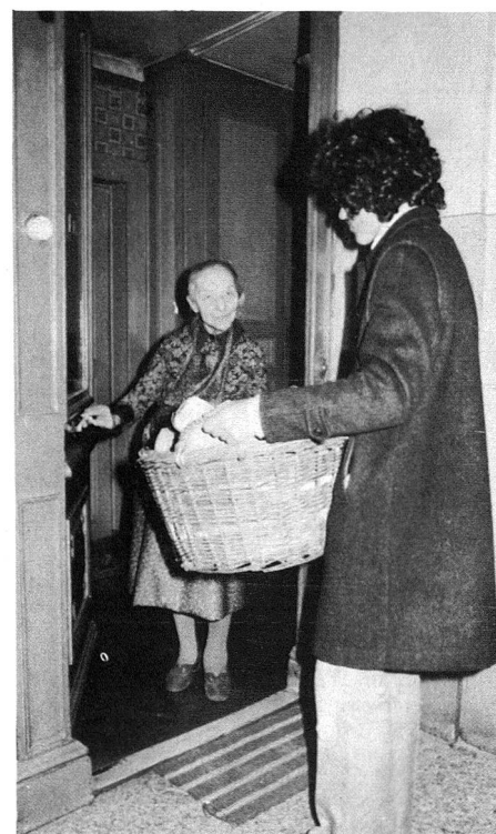
A la demande du service des assistantes bénévoles de la section ou encore du Service social de la ville et des paroisses, les jeunes se rendent au domicile de personnes seules ou de couples âgés et handicapés, pour les sortir de leur isolement ou leur donner un coup de main, porter le combustible de la cave au 4e étage, remonter la pendule, faire des commissions.