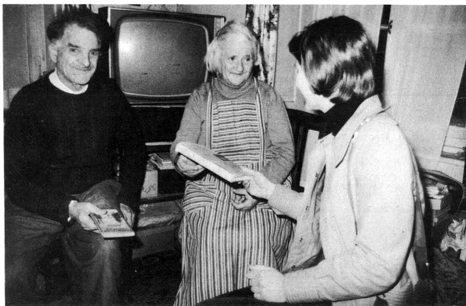
Le «Service bibliothèque Croix-Rouge» a été créé par le groupe Jeunesse Chaux-de-Fonniere en automne 1974. Deux jeunes filles et un jeune homme apportent au domicile de personnes âgées ou invalides des livres qu'ils sont allés emprunter à la Bibliothèque municipale; à ces occasions, des contacts chaleureux se nouent bien entendu entre les jeunes et les personnes âgées.