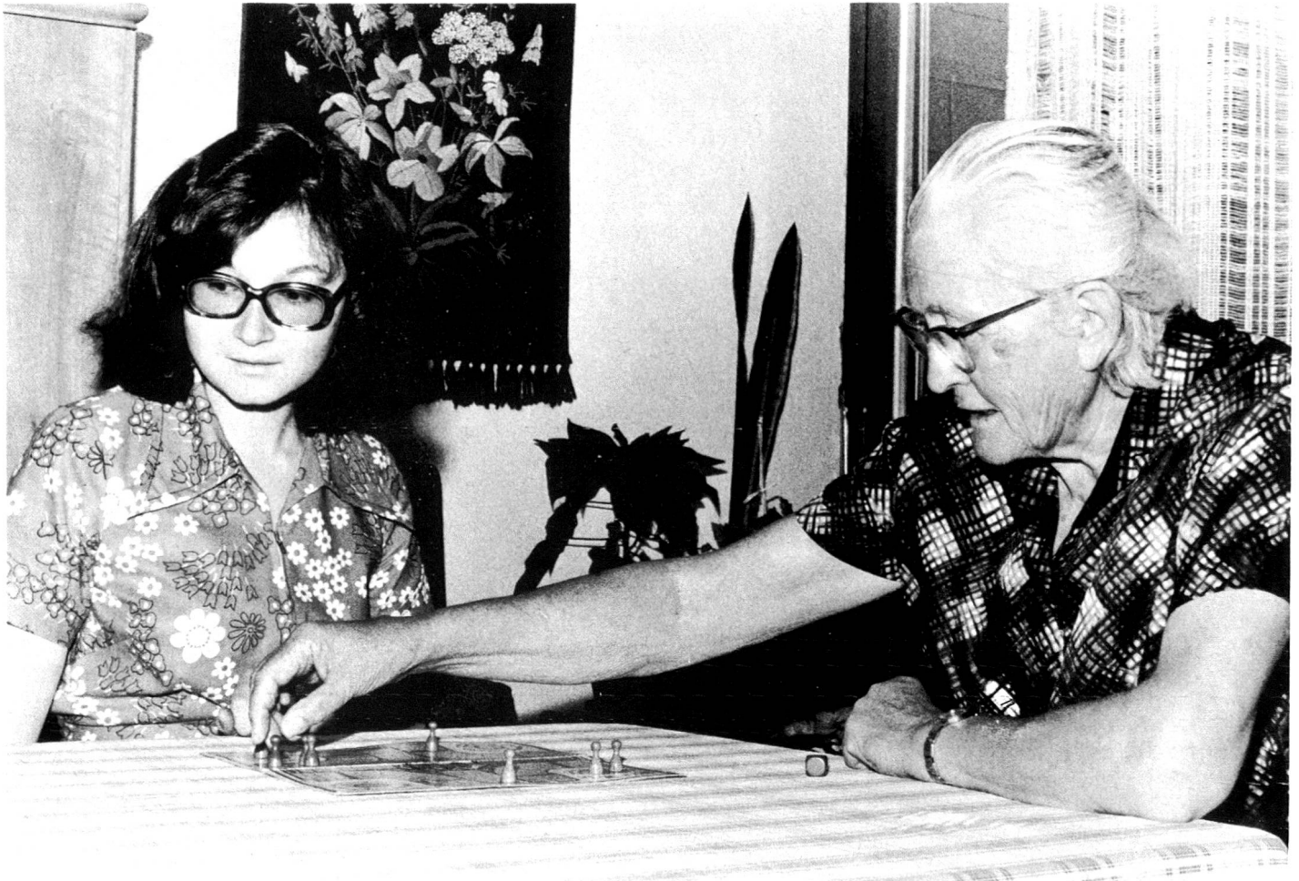
Une visite, le temps de bavarder, de jouer à un jeu de société, il n'en faut guère plus pour illuminer la journée d'une solitaire...

Une «petite-fille» de remplacement pour l'aider à faire une promenade à petits pas, pour la sortir de son isolement: un vrai bonheur!