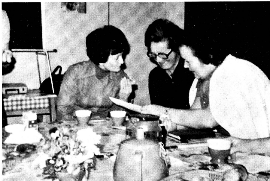
Un groupe de travail examine en commun une «situation» donnée par la monitrice. Le débat est animé...