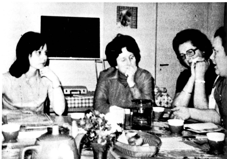
L'une des participantes exposant le point de vue de son groupe. Il sera, au besoin, revu et complété par la monitrice et par les autres participantes.