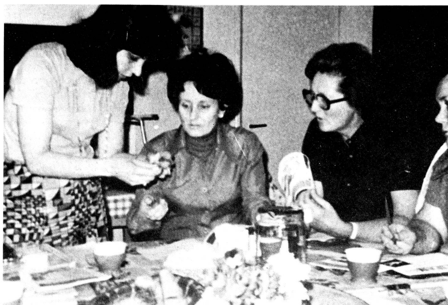
En fin de leçon, la monitrice fait circuler brochures et «gadgets» afin d'assurer à son groupe un maximum de connaissances théoriques et pratiques.