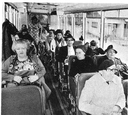
Le grand car peut emmener 23 passagers. Tout le monde est là. En route!