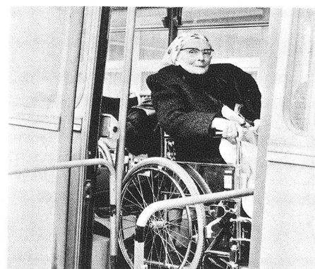
Le sourire timide d'une grand-maman juste avant le départ.