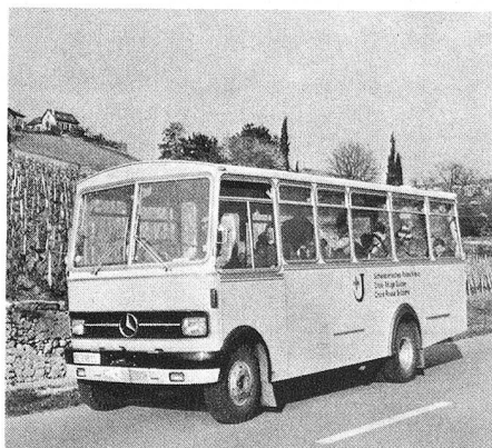
Sur la route de la Côte, vers de nouveaux horizons...