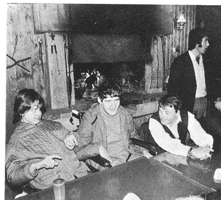
Au milieu du voyage, une petite collation est bienvenue.