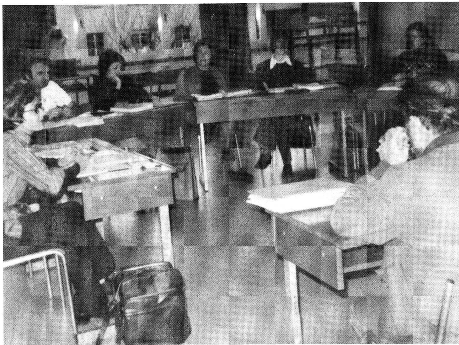
Immagini di una lezione teorica e di una pratica, durante il corso monitrici/monitori organizzato dalla Croce Rossa svizzera e svoltosi alla Scuola cantonale infermieri a Bellinzona.