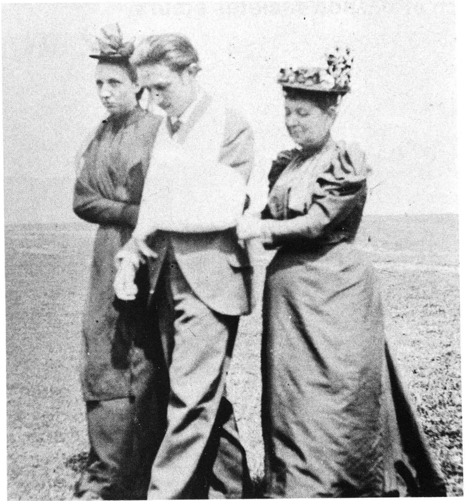
La Belle Epoque. Pas facile le bouche-à-bouche avec ce chapeau.

Tant de gentillesse méritait certes, d'être, elle aussi, récompensée. Aussi, cher M. Renson, nous publions ici vos «perles» rétro. Un grand merci!