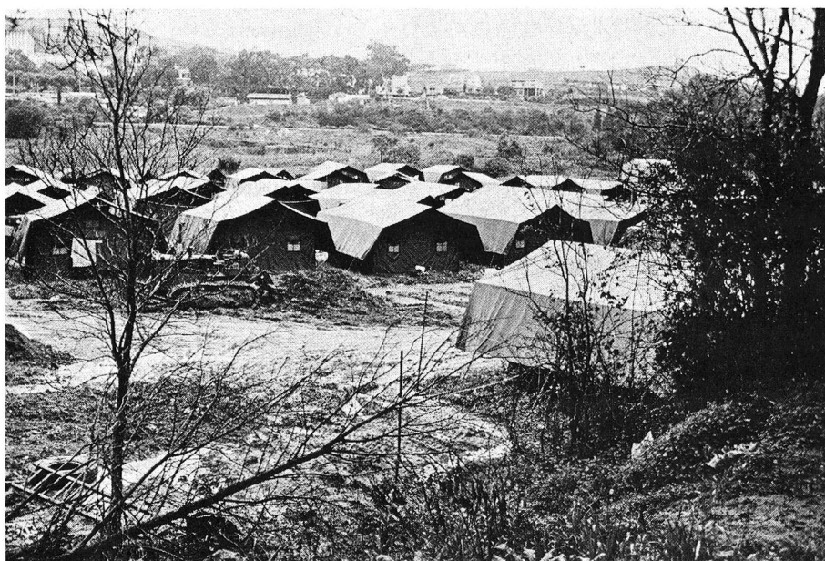
Camp d'accueil de la Croix-Rouge portugaise pour les réfugiés d'Angola.

Souvenez-vous... Les rapatriés venant d'Angola, du Mozambique et de Timor commencèrent à affluer au Portugal, en nombre sans cesse croissant au milieu de 1975. Depuis bientôt deux ans, la Croix-Rouge portugaise, aidée par de nombreuses Sociétés sœurs, leur prodigue son assistance. Durant la première phase de cette opération de secours, alors que l'on ne pouvait pas encore connaître l'ampleur des rapatriements, la Société, avec l'appui des services gouvernementaux compétents, de l'Institut national pour les rapatriés (IARN) et du CICR, a lancé à l'intérieur du Portugal, un appel sollicitant des dons pour couvrir les besoins des rapatriés arrivant chaque jour. Activement occupé à accomplir ses tâches traditionnelles dans