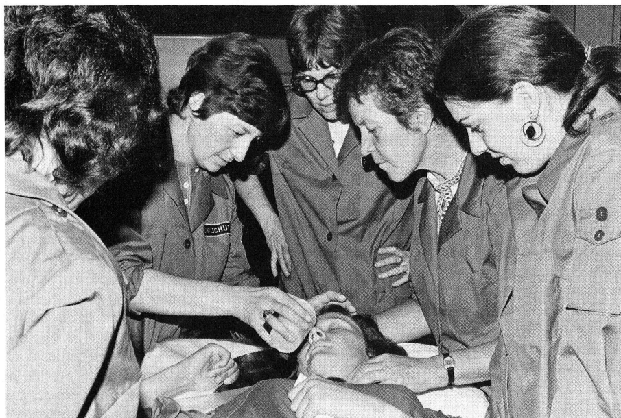
Les instructrices de la protection civile qui préparent les hommes astreints au service et les femmes qui se portent volontaires à des tâches sanitaires, sont elles-mêmes formées par des infirmières de la Croix-Rouge suisse. Notre photo: futures instructrices de la protection civile dans l'installation souterraine de Rubigen.

Il est clair que la responsabilité du SSC incombe aux organes de la Confédération, des cantons et des communes. De ce fait, les tâches abordées par la CRS et ses sec-