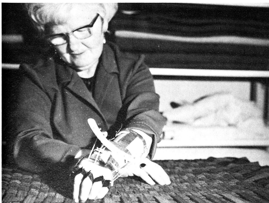
A demi paralysés, se mouvant avec difficulté, ayant parfois des problèmes d'élocution, les patients retrouvent gaieté et raison d'être grâce à l'ergothérapie.