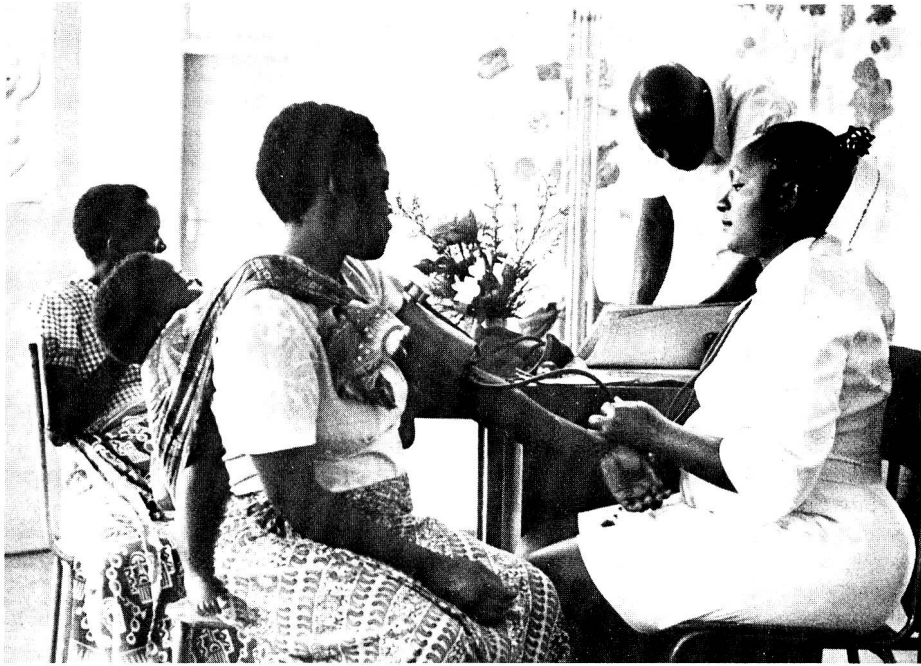
Mesure de la pression sanguine au cours d'un contrôle médical périodique.