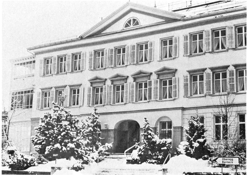
En 1892, Dunant fut admis à l'hôpital de district de Heiden où il vécut les dix-huit dernières années de sa vie.

C'est grâce aux efforts qu'ils a déployés en faveur de la cause de l'humanité, que la plus grande guerre des temps modernes s'est vue dépouillée de nombreuses horreurs qui auraient été siennes en d'autres temps, et que des milliers de malades et de blessés ont pu bénéficier de la généreuse coopération des belligérants et des neutres venus à leur secours... C'est grâce, enfin, à M. Dunant que ces idées d'humanité ont pu être réalisées d'une façon pratique et systématique?»