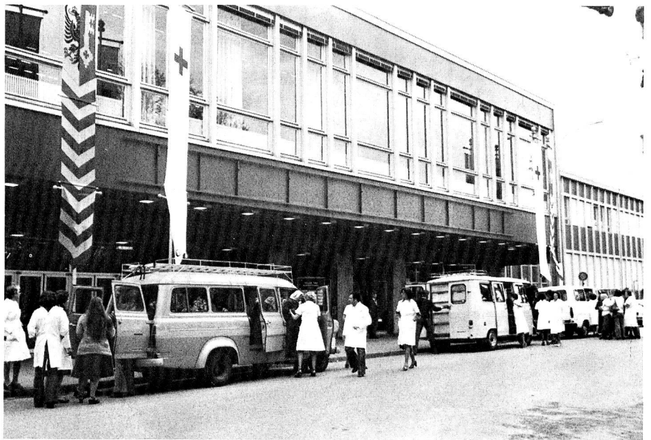
Arrivée des invités d'Henry Dunant au Palais des Expositions. Démonstration de majorettes agrémentant le repas.

tout aussi gratuitement à la joie de cette journée. Les frais furent insignifiants. Pour des gens trop souvent cloîtrés, sans joie, sans espoir et sans autre horizon bien souvent que les quatre murs d'une