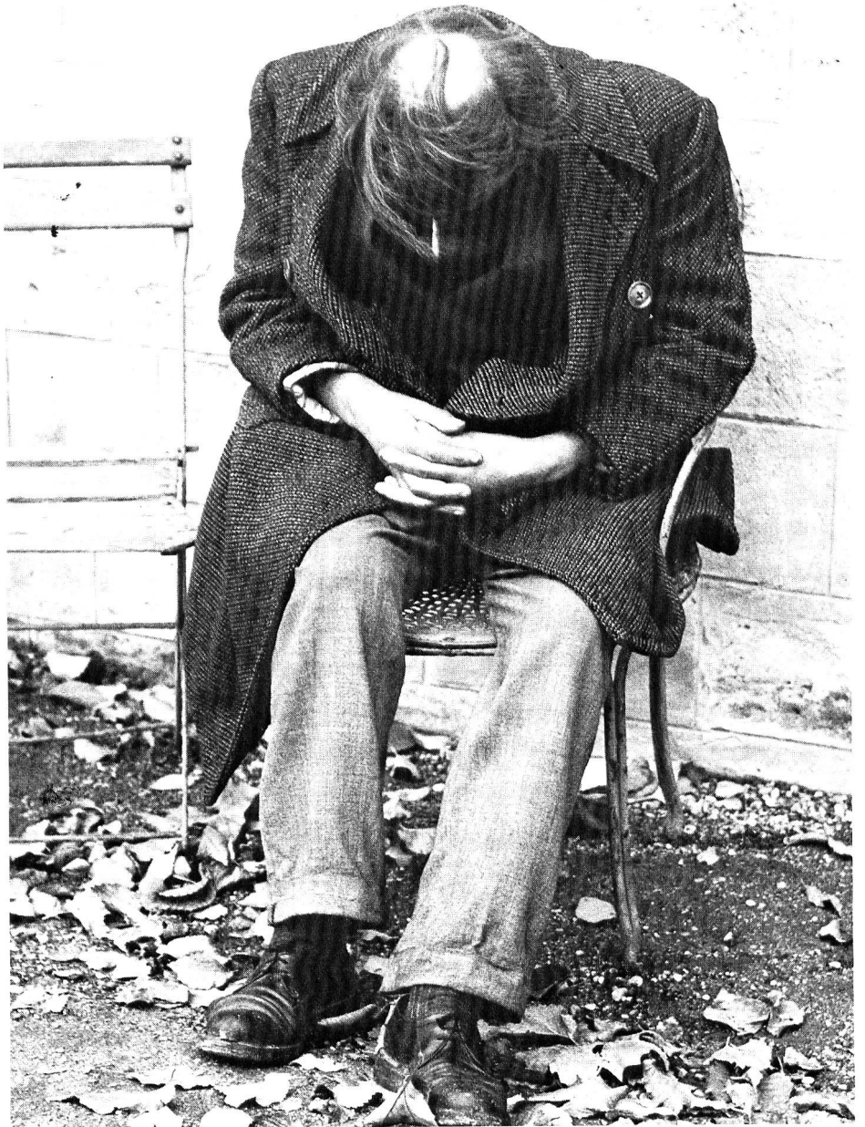
... s'abandonne à la solitude...