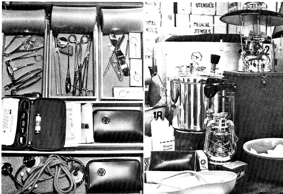
A gauche, matériel médical; à droite, assortiment de matériel d'utilité générale.