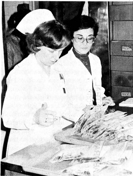
Ces deux photos ont été prises au centre Drakopoulion. A gauche, le personnel du centre prépare et sélectionne les sachets; à droite, un petit malade attend patiemment la fin de sa transfusion.