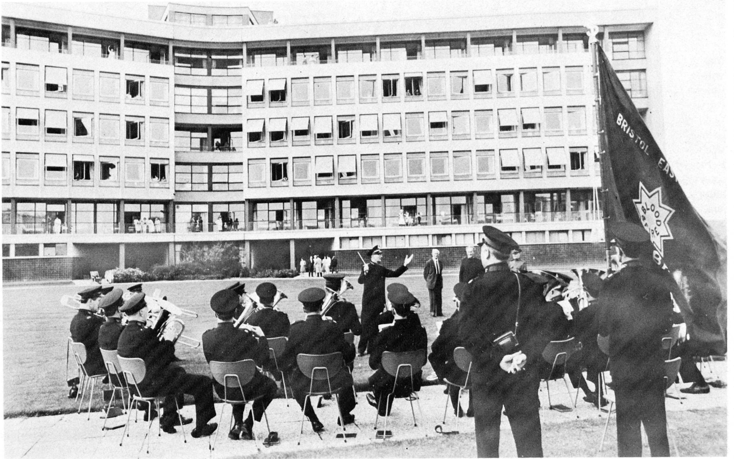
En Suisse, 600 musiciens et 900 chanteurs participent aux services religieux donnés dans les hôpitaux et les foyers divers.