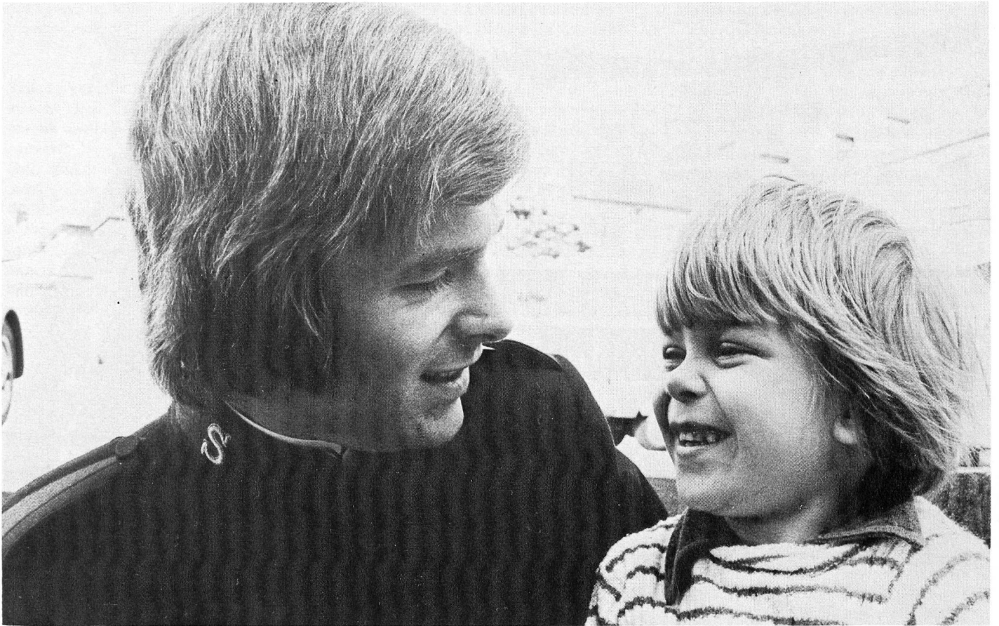
Dans ses institutions et ses jardins d'enfants, l'Armée du Salut s'occupe quotidiennement de plusieurs milliers d'enfants.