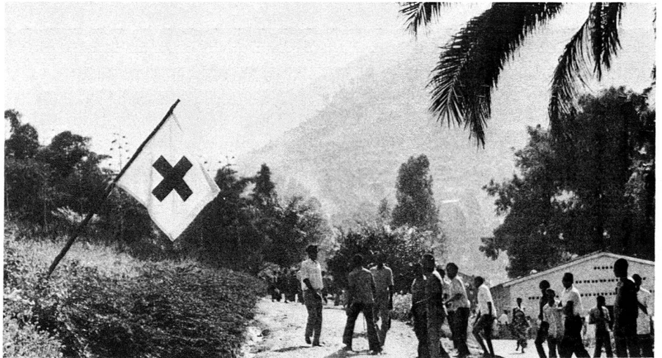
En Afrique, une séance de prise de sang est une fête qui rassemble beaucoup de monde autour du drapeau de la Croix-Rouge.

L'aide de la Croix-Rouge suisse consiste à conseiller ses partenaires africains dans les problèmes d'organisation, de collecte, de transformation, de stockage et de distribution du sang,