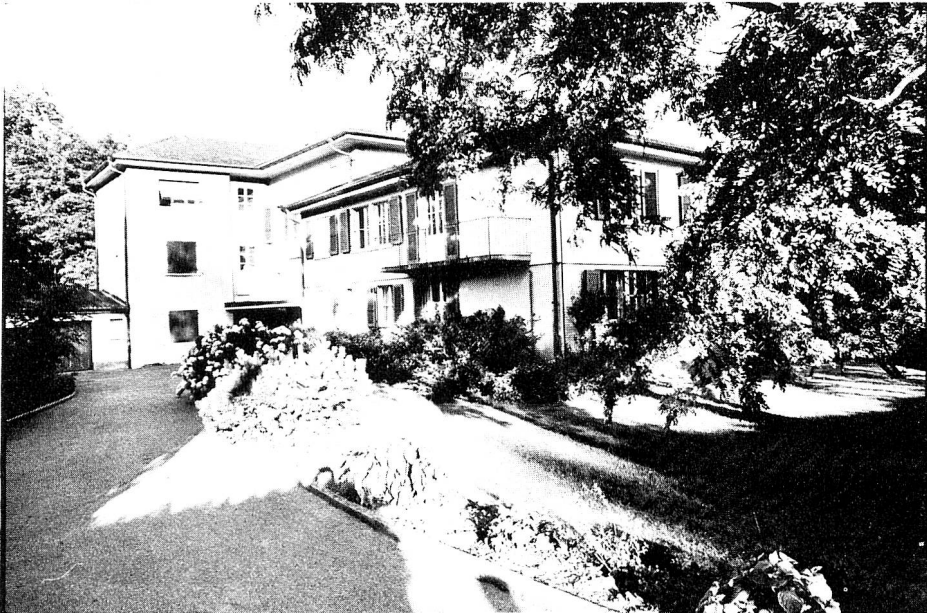
La maison de Selzach (ancien orphelinat) dans le canton de Soleure.