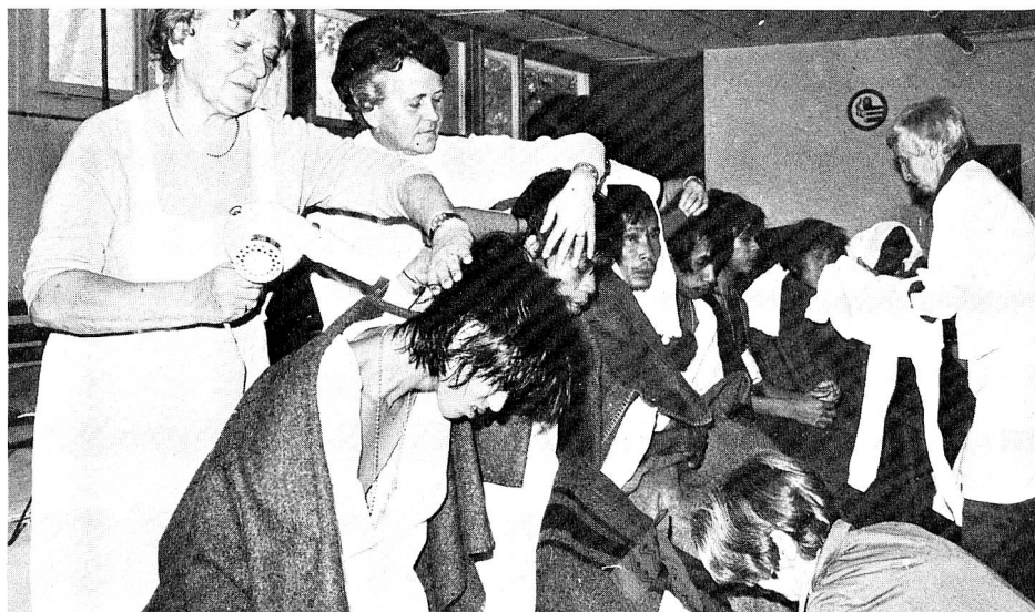
A Buchs, les réfugiés sont pris en main par des bénévoles énergiques et chaleureuses de la section locale de la Croix-Rouge suisse.

Les réfugiés indochinois qui ont eu la chance d'être «sélectionnés» par la délégation suisse s'envoleront pour la Suisse où ils arriveront à Klotten par un petit matin d'été qui va leur paraître très frais. Ils seront ensuite acheminés, après un arrêt à Buchs, dans les différents centres d'accueil organisés par les principales œuvres d'entraide. La Croix-Rouge suisse, pour sa part, a été chargée d'ouvrir le 4 août un centre d'accueil à Selzach, dans le canton de Soleure, et un second à Salvan, dans le Valais, qui a ouvert ses portes le 1er septembre 1979. Une collaboratrice de notre rédaction s'est rendue à Buchs où s'effectuent les contrôles sanitaires, puis à Selzach où les réfugiés ont été acheminés le même jour.