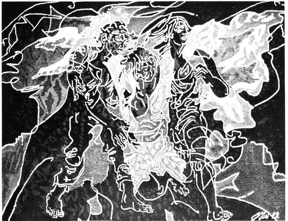
Tapissierie de Hans Erni décorant le hall d'entrée du nouvel immeuble du Secrétariat central de la CRS.