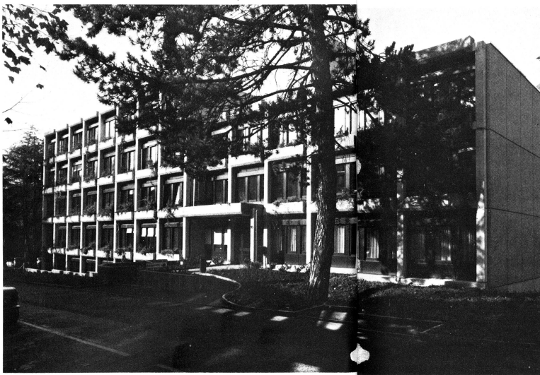
Nouvel immeuble du Secrétariat central de la Croix-Rouge suisse situé Rainmattstrasse 10, à Berne.

En dehors du Service du Secrétaire général proprement dit qui regroupe 5 personnes, le Secrétariat central comprend les services suivants: