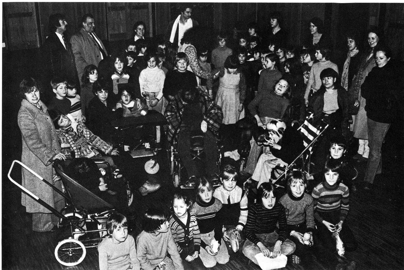
A Assens, une petite localité du Gros-de-Vaud près d'Echallens, les deux classes du village reçoivent des petits camarades handicapés. Une fois «la glace rompue», tout le monde se retrouve ensemble pour jouer par terre.