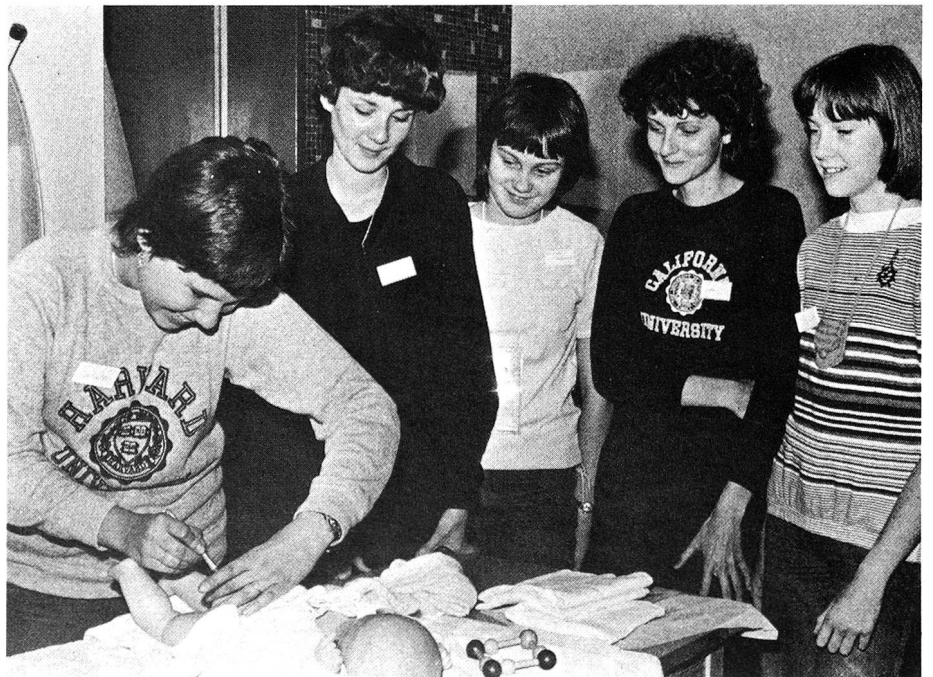
Ces cours de baby-sitting, organisés par les sections de la Croix-Rouge suisse, s'adressent à des adolescents de 14 ans et plus, qui seront ainsi bien préparés à s'occuper des bébés et des petits enfants.