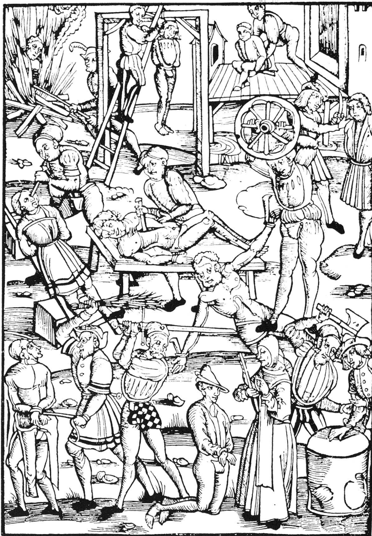
La torture au bon vieux temps...

La collaboration internationale dans tous les domaines, et dans le domaine humanitaire également, requiert une ouverture vers l'extérieur et un affaiblissement de la conscience de souveraineté. Nous devons avant tout tenter