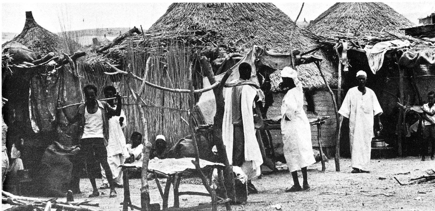
Dans le camp de réfugiés de Khashm el Girba.

Nous nous proposons donc d'éditer quatre fois l'an quatre pages relatant notre travail à l'échelle internationale. Cette fois-ci, nous présentons un petit reportage illustré sur le Soudan. La prochaine fois, il sera question de nos interventions au Liban et en Thaïlande.