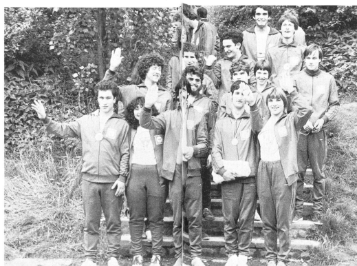
← Les athlètes romands: tous pensionnaires de la Cité des Enfants, St. Léger sur Vevey.