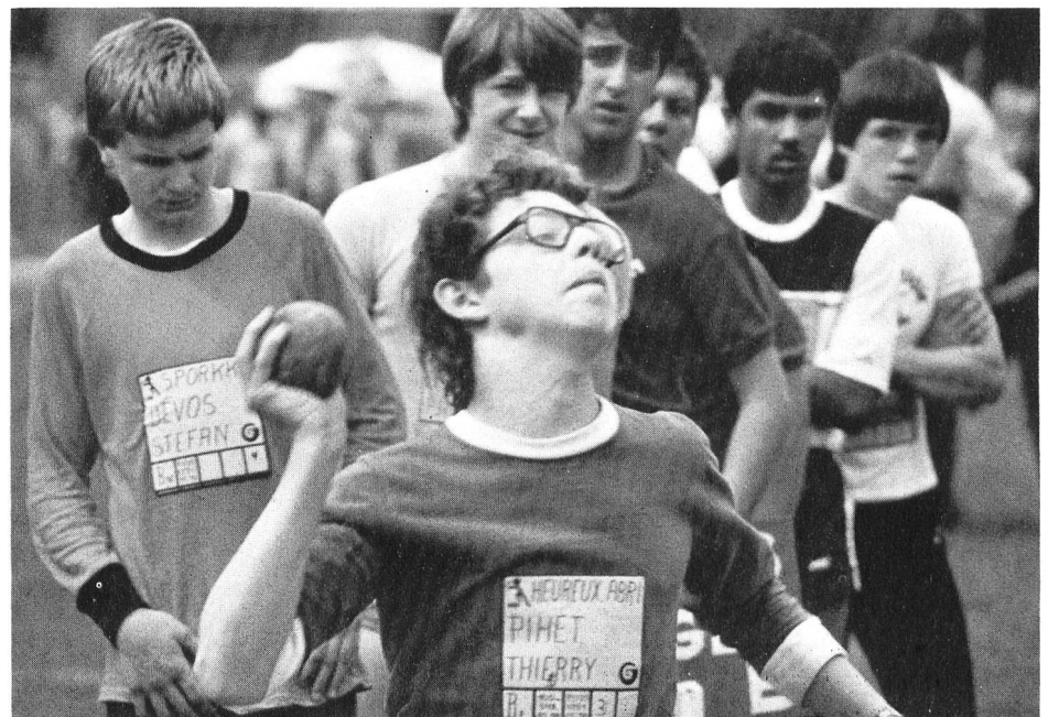
Encore un petit effort...

rompre. C'est son père. «Ma fille n'aimait pas le sport. Mais depuis quelques mois, elle l'accepte volontiers...» Et il ajoute, ému et fier: «...elle s'est vraiment dépassée».