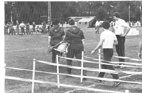
Les secouristes volontaires de la Croix-Rouge belge.

5 La Suisse était représentée par 66 athlètes dont 14 Romands, pensionnaires de la Cité des Enfants de Saint-Léger-sur-vevey.