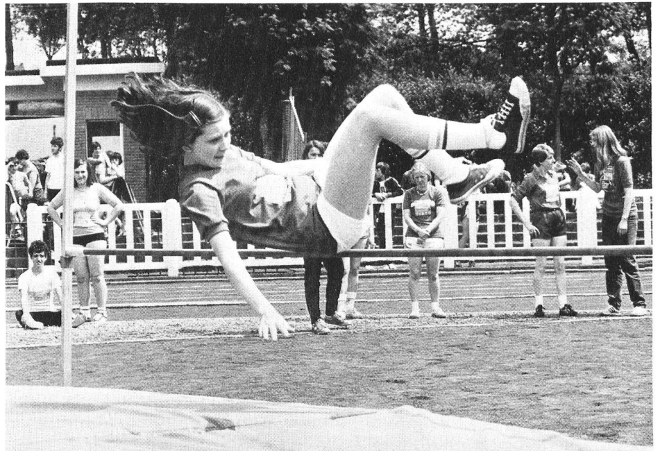
... Ca y est! L'obstacle est franchi.