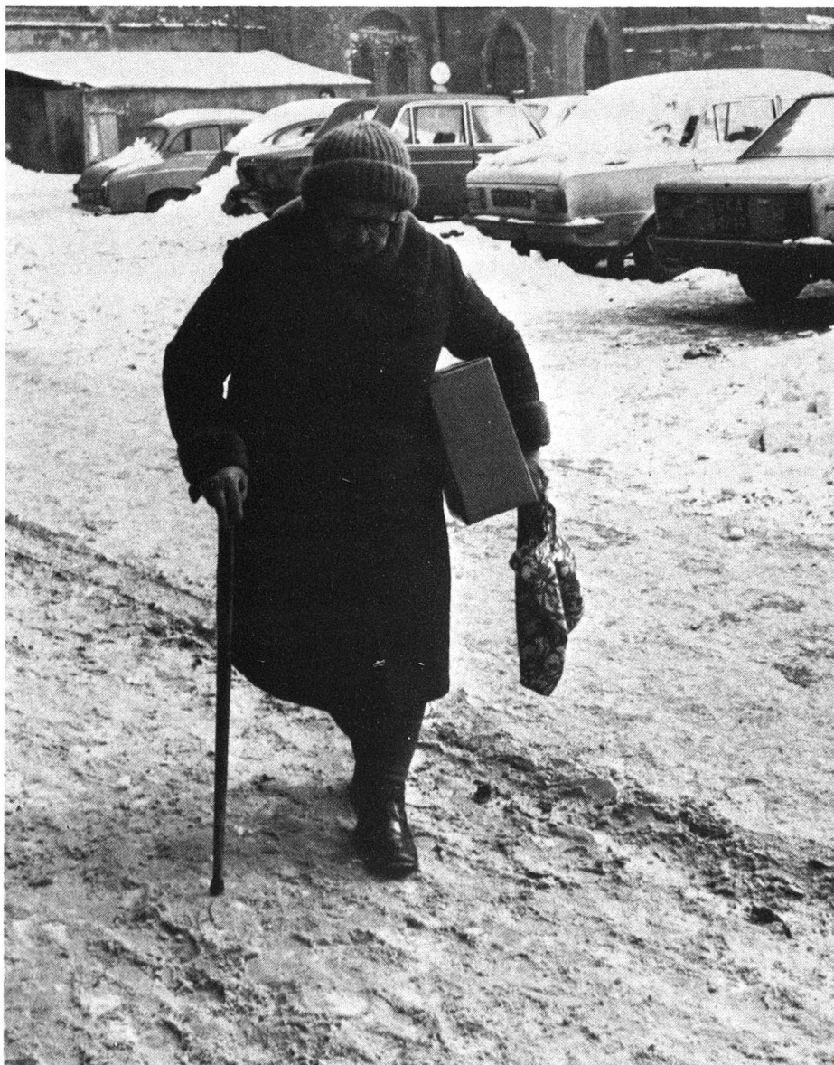
Cette vieille femme vient de recevoir à la Croix-Rouge, à Gdańsk, un colis de vivres et produits de première nécessité. (Provenance du colis: Croix-Rouge italienne.)

Mais la liste des personnes assistées est longue: environ huit mille personnes âgées et handicapées et cinq