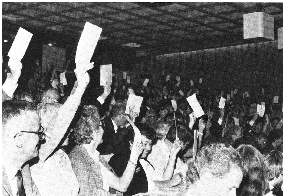
Vote à main levée pour les affaires courantes,

On prévoyait, certes, que cette assemblée, au cours de laquelle devait être élu le nouveau président central de la Croix-Rouge suisse, attirerait un nombreux public, mais la quote des pronostics fut si largement dépassée que l'on dut, en dernière minute, se mettre en quête de locaux de réunion plus vastes que ceux qui avaient initialement été choisis!