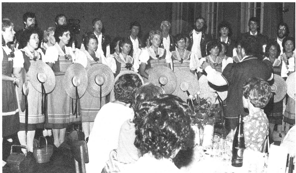
La chorale fribourgeoise exécutant quelques chants.