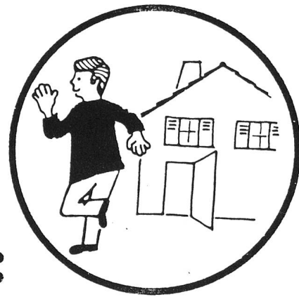
Avverte il vicino e invita alla solidarietà.

Tra gli scopi che la Croce Rossa svizzera si prefigge, riveste grande importanza lo sviluppo delle cure extraospedaliere, ossia di quell'assistenza di tipo sanitario che ciascuno dovrebbe essere in grado di dare a un familiare o a un vicino ammalato a casa, e il cui stato non richiede necessariamente un ricovero in un istituto di cura. A questo proposito sono noti, proprio per la loro ampia diffusione tra la popolazione, i corsi Croce Rossa, attraverso i quali ognuno può apprendere quelle nozioni fondamentali per assistere correttamente una persona ammalata, handicappata, anziana.