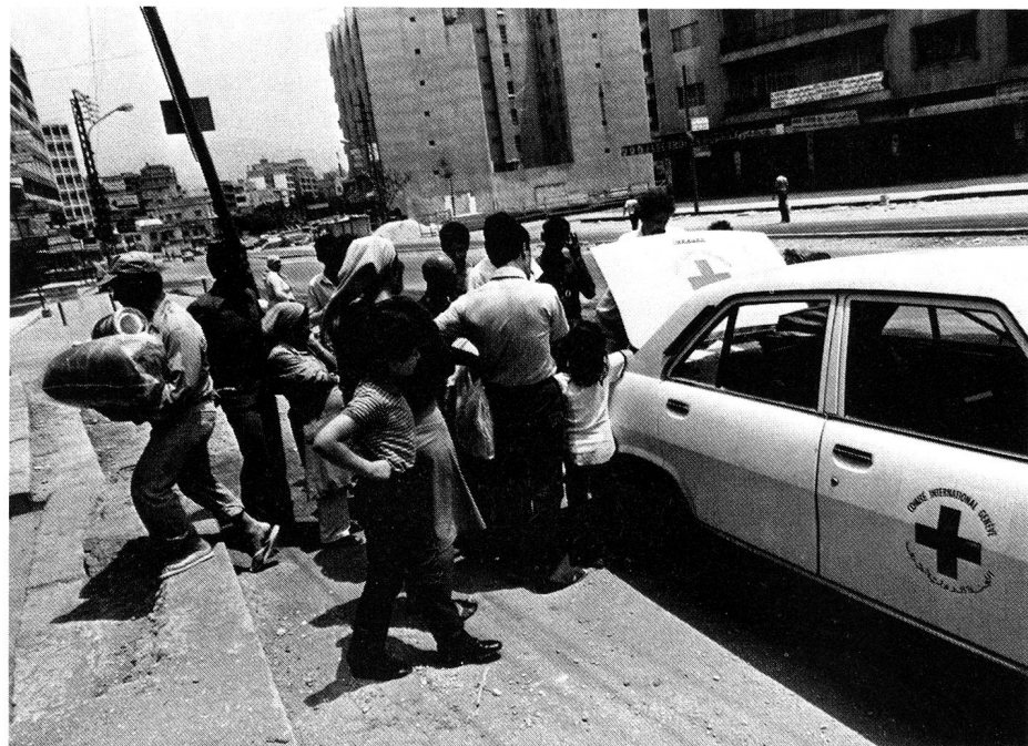
Une accalmie dans les combats permet à un délégué du CICR d'apporter des secours à une famille réfugiée dans un abri.

Comme nous l'avons déjà mentionné au début, les combats sporadiques occasionnèrent de nombreux blessés, qui furent évacués et soignés dans les hôpitaux de la ville. La banque du sang de la section Croix-Rouge de Tripoli a joué un rôle décisif, tandis que le CICR fournissait des médicaments et du matériel médical aux hôpitaux et dispensaires où les blessés avaient été évacués. En accord avec le corps médical local et les directeurs des hôpitaux, le CICR avait équipé un camp avec tout le matériel médical nécessaire en cas de combats prolongés.