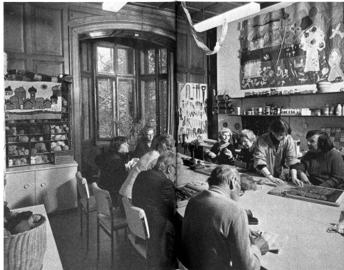
Une séance d'ergothérapie d'animation pour ces patients d'un home de jour.

– que cette thérapie occupe une place toujours plus importante dans le cadre des soins extra-hospitaliers. De nombreux exemples positifs sont là pour en témoigner.