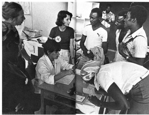
Délégués médicaux en Angola

Quatre fois par an, le CICR organise des cours de formation pour délégués au Centre de Cartigny, près de Genève. Pendant une semaine, une vingtaine de participants, venus de toute la Suisse, y reçoivent un enseignement théorique et pratique. Au programme des cours figurent des thèmes tels que l'organisation, l'activité et le financement de la Croix-Rouge, les Conventions de Genève et leur application, les visites aux prisonniers, l'assistance aux populations, la recherche des personnes disparues, les interventions médicales, etc. Mais une grande place est également réservée aux exercices pratiques, sous forme de jeux ou de répétitions; un exemple célèbre: la technique de la visite d'un lieu de détention: le professeur, un ancien délégué, tient le rôle d'un directeur de prison qui refuse aux délégués l'autorisation de visite; le rôle des délégués, tenu par quelques candidats, consiste à essayer de convaincre ce directeur récalcitrant... Et il ne s'agit pas de jeux «inventés» pour la circonstance,