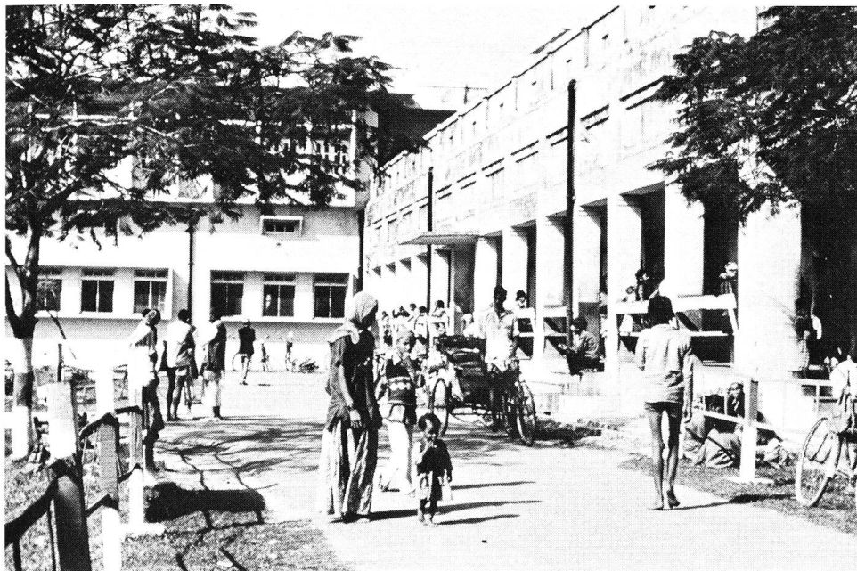
L'hôpital principal de Nepalganj: la clinique ophtalmique et une polyclinique ont été aménagées dans ces locaux.

Plusieurs centaines de patients peuvent être ainsi soignés en l'espace de peu de temps. Ces patients sont ravitaillés par la section Croix-Rouge locale et par les personnes qui les accompagnent.