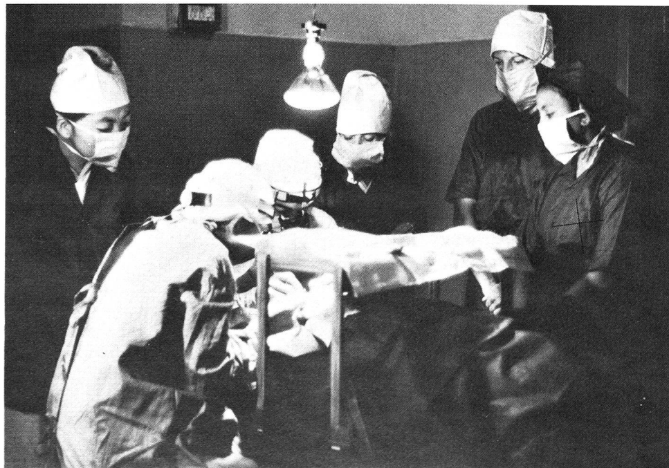
Vue de la salle d'opération.

les cas et cela l'est encore parfois, pour la lèpre. Cette maladie était considérée comme le résultat d'une mauvaise conduite et la victime était rejetée. Tandis que les aveugles sont