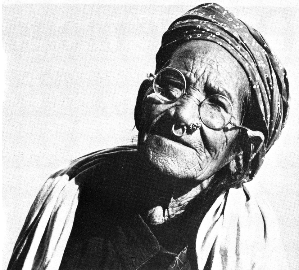
Opération réussie pour cette patiente, que la cataracte avait rendue aveugle.

● La formation: la formation de personnel local revêt une grande importance. Outre l'ophtalmologue suisse, un jeune médecin népalais travaille à ce projet, profitant ainsi de l'expérience des Suisses et gagnant en confiance en lui. Le personnel infirmier attaché à la clinique ophtalmolo-